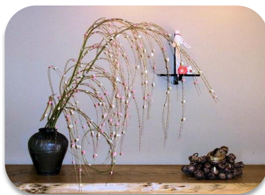
当日はお正月にお花の代わりとして飾ったという餅花を作ります。

日 時：平成 30 年 12 月 3 日 (月) 13:30~15:30 受付 13:10~