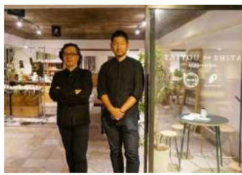
10月7日デザイナーズトーク