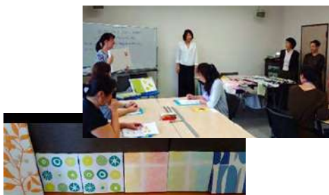
10月6日 一般消費者セミナー