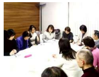
ビジネスクラブミーティング