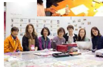
有志による ミニセミナー