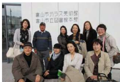
11月8日, 9日 icon交流会in氷見