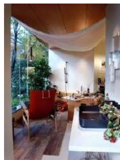
出会う。こだわりのmy favorite 心と時間のシンプルリッチを手に入 れる @le bain showroom