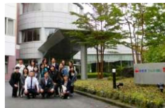
TOTO 1泊研修会(東富士研修所)

通常の活動としては、2014年の設備機器メーカーのデータ更新を目的に10か所（15メーカー）のショールームを訪問、調査研究活動をすすめました。この内容はさらにブラッシュアップして次年度にはユーザー向けのガイドBOOKにまとめていく予定です。