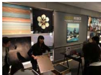
イエローコーナージャパン見学会

3月には今後のビジネス展開を視野に賛助会員にiconとのビジネスに関するアンケート調査を実施し、今後の企画に反映させる準備ができました。