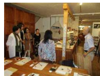
9月16日 ショールーム見学会