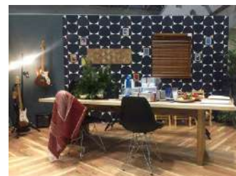
ウッドデザイン賞展示