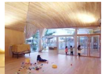
とらのこ保育園 (カーテン提案)