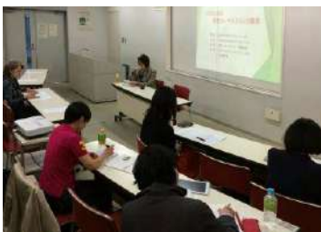
4月19日CPD共通必須講座