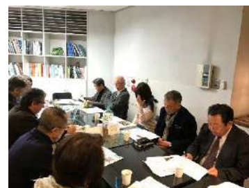
インテリア関連13団体との情報交換会