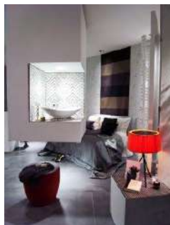
あそびゴコロをまとって暮らす Benvenuti a casa mia! ようこそ我が家へ！ @RIVIERA showroom