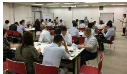
第4回クロスミーティング