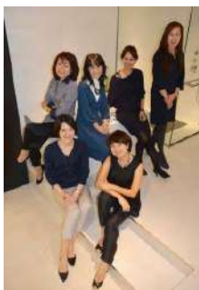
パウラボメンバー紹介 ポスター作成

脱・洗面所！のコンセプトのもと、住宅の洗面室も“自由にコーディネートできる”ことをもっと多くの人に知っていただきたい！との思いで、洗面室のmoreインテリア化を目指して活動しています。見学会などの研究活動だけでなく、昨年度に続いて企業からオファーをいただき、セミナーやショールームの企画展示を行いました。（4月25日～5月24日 リビエラ・東京ショールーム、11月17日～29日 ショールーム・ルベイン）