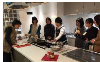
パナソニック IH実習