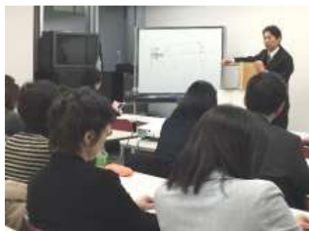
造作家具プレ講座

CPDプロジェクトチームを立ち上げ、3年経過したCPD制度のブラッシュアップとカリキュラムの再構築を行い、本年度はCPD照明必須講座を3回、造作家具プレ講座を1回実施しました。CPD講座の他、パースセミナー初級、中級講座を実施。特にパースセミナー初級講座は、受講希望者が多く、3回実施しています。また、ビジネスDiv.に協力し「リフォーム入門ゼミ2017」を5回開催。その他、遠隔地の会員に向けZOOMによる受講を試験的に行いました。2018年度からZOOMでの受講が可能になります。（一部講座は除く）