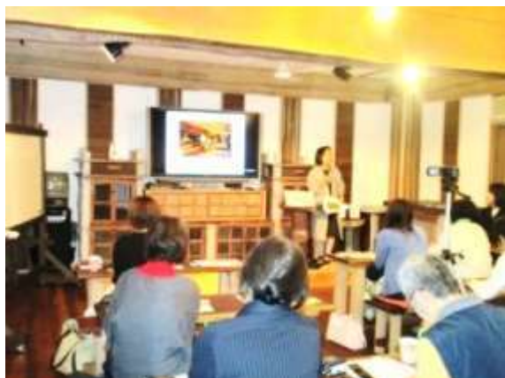
「リノベーション・ラボ」発足 記念セミナー