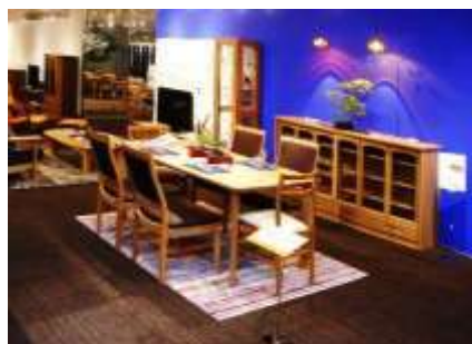
ワールドインテリアウィーク展示