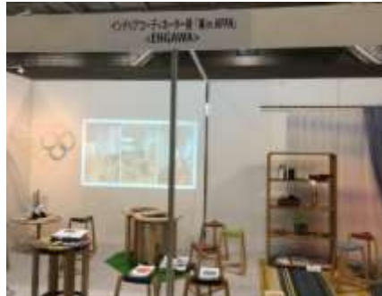
WOODコレクション2018(モクコレ) 木づかいクラブと共同初出展