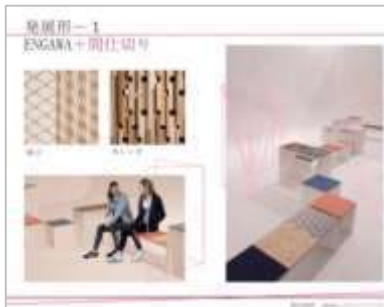
特別発表会資料(一部)