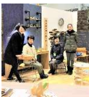
ウッドデザイン賞 ライフスタイル展示