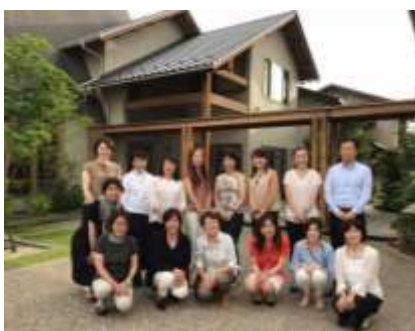
「古民家再生システム」見学