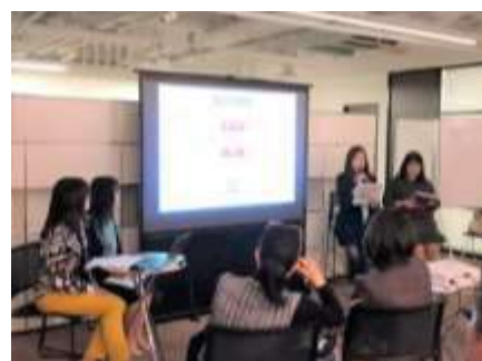
INTRIOR DESIGN MEETING セミナーで登壇のパウラボメンバー