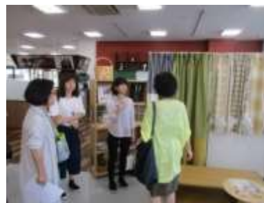
ショールーム見学会