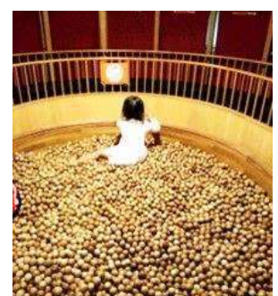
東京おもちゃ美術館