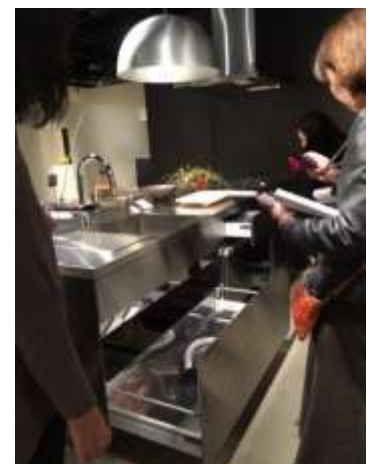
サンワカンパニー ショールーム見学