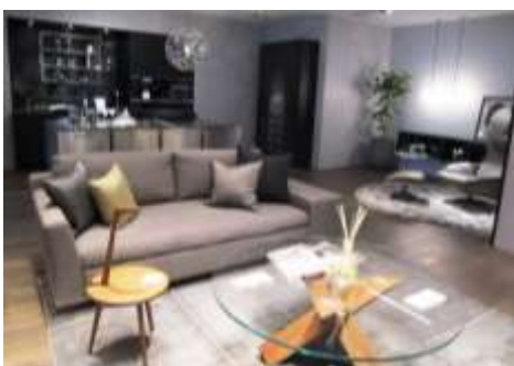
ジーマティック社 青山ショールーム見学

5年目を迎えたキッチン研究会のテーマは、新築・リフォームのどちらにおいても要望の多い「キッチンバックのプラン作り」とし、活動しました。ブレインストーミング形式でプランを考え、各自が図面を書いて持ち寄るという形で進めていきました。キャビネットの構造や、パーツなどの知識を学ぶため、メンバーがキャビネットの模型を製作し、ヒンジやレールなどの動きを実際に確認できたことはとても有意義な体験でした。今年度はフルタイムでの仕事のメンバーが多く、ミーティングは全て夜の時間帯の開催となりました。