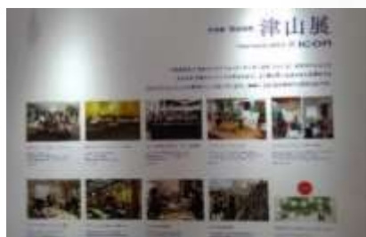
FOR GOOD 津山展