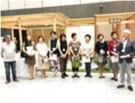
ものづくり・匠の技の祭典

その他、2017年8月「ものづくり・匠の技の祭典」交流会参加、2017年10月「省エネ・エコリフォーム&東京の木・多摩産材展」に出展しました。