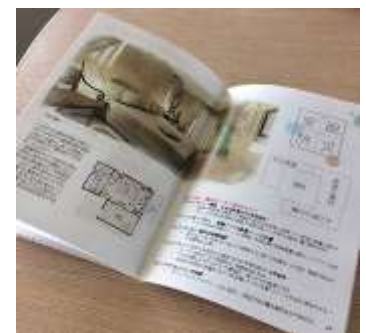
2017春 小冊子テスト版