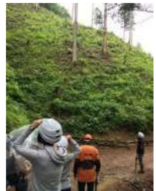
多摩産材見学ツアー