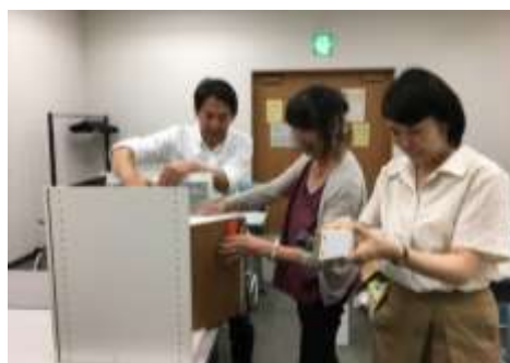
定例ミーティング ヒンジ・レールの確認