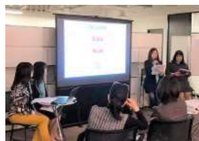
富山でパウラボ活動紹介・交流会