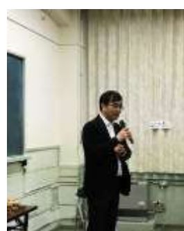
多田館長のセミナー