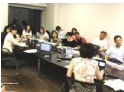
リフォーム入門ゼミ(良質リフォームの会)