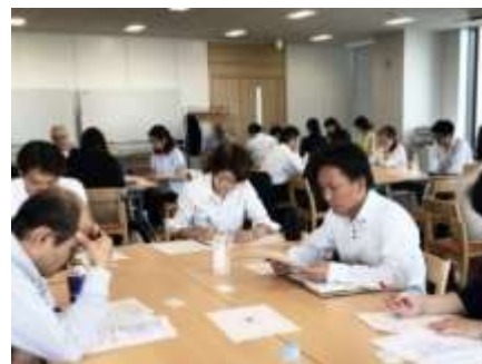
ミニクロスミーティング カリモクお台場ショールーム