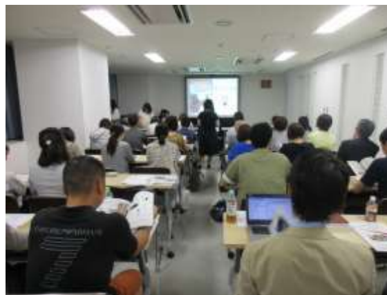
パウラボセミナー