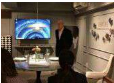
照明・ホームファニッシングコラボ講座