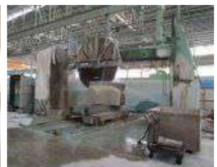
岐阜県関ヶ原石材株式会社工場見学 天然石を切断中