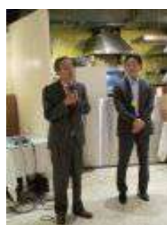
懇親会 賛助会員の挨拶