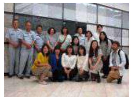
関ヶ原石材にて、天然石のレクチャーを受ける