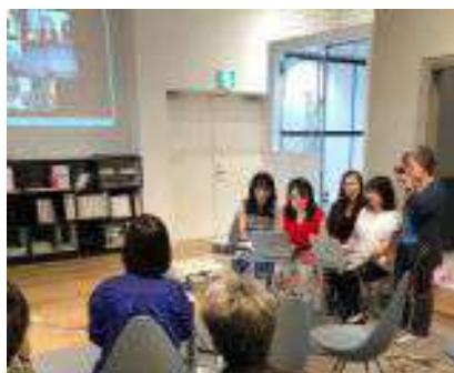
中四国支部開設記念セミナー