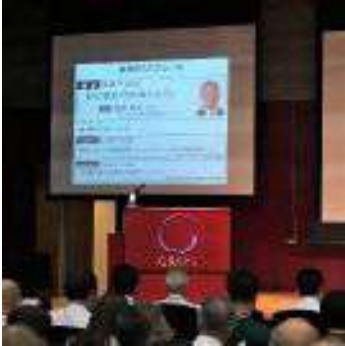
東京消防庁セミナー受講で情報収集 (8月30日)

インテリアコーディネーター(以下IC)の視点から「防災」と「暮らし」や「インテリア」を考え、「Joy of Living=暮らしを楽しむ」方向からアプローチするという主旨のもと、ICが持つべきスタンダードな知識として小冊子にまとめようとしています。冊子構成や文章など活発な意見交換を重ねています。本作りのミーティングを通して、メンバーは知識や思考がより深まり、ICとしてのレベルアップを実感しており、研究会としての成果も得られています。