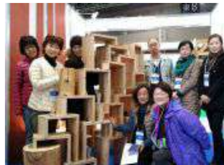
WOODコレクション デザイン&設営