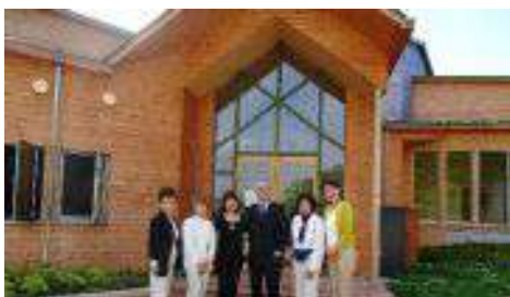
福島県 こども園りのひら見学会

7年目を迎えた子ども研究会では、これまでの活動を更に深化させ、「子どもの内面の成長に深く関わる空間」をテーマに研究を続けてきました。11月には、日本色彩学会主催の平成30年度研究会大会にて「ルドルフ・シュタイナーの人智学を反映したこども園・りのひらの色」を発表する機会を頂きました。子どもの感性を豊かに育むために、「空間の質」を高めていくことがいかに重要であるかなど、りのひらの園舎のライドと共に発表し、研究会としては大きなステップアップとなりました。