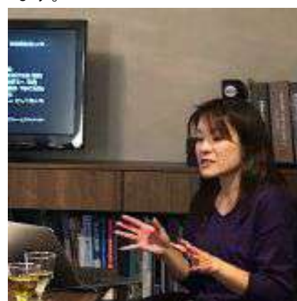
昨年度から続く「会員の仕事実例」を聞くシリーズ

東京松屋ショールームで伝統的技法により手作業で作られる「江戸からかみ」について理解を深めました。終了後はフレンチレストランでランチ会 (10月2日)