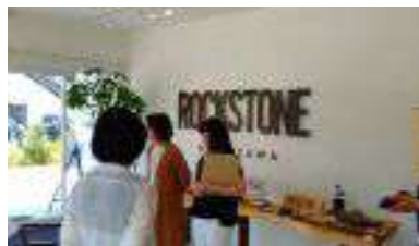
ロックストーンショールーム