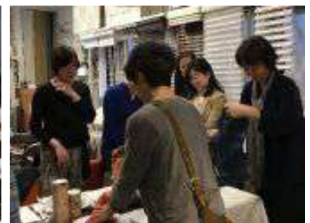
ホームファニッシング講座