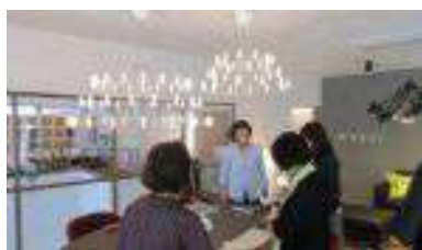
織江ショールーム