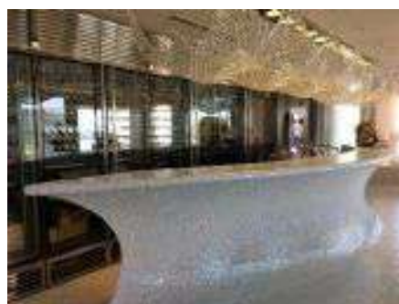
トーヨーキッチンスタイル名古屋ショールーム ゲスト用スペシャルキッチン