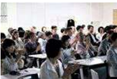
満席の定時社員総会

総会の後、「icon活動発表会」を開催しました。「2017年ワールドインテリアウィーク in 春日部」「FOR GOOD 津山展」「2020 T・O・Pプロジェクト」の各プロジェクトチームと、自主的に活動をするグループ「子ども研究会」「防災とインテリア研究会」「キッチン研究会」「powder room labo パウラボ」「木づかいクラブ」と、各チーム・グループの個性溢れるプレゼンに会場がわきました。最後は会場を地下のカフェーズに移し懇親会を開催。100名を超える出席があり、盛会となりました。