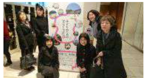
「子どものための建築と空間展」見学会