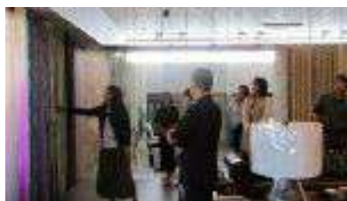
サンゲツショールーム