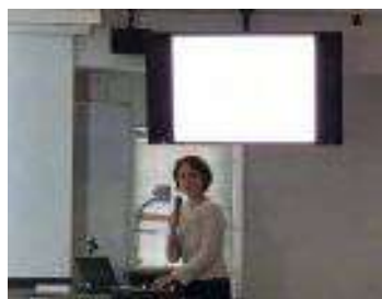
日本色彩学会での発表