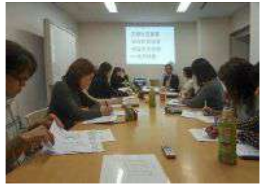
リフォーム入門ゼミ(良質リフォームの会)