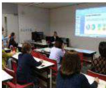
勉強会 遠隔地のメンバーはZOOMで参加