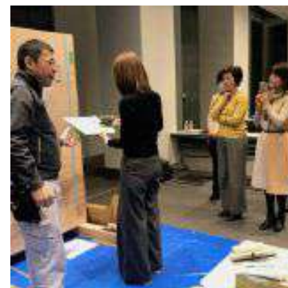
「健康と環境に配慮した壁装材を深く知ろう」シリーズ第3弾

代官山のゼロファーストデザインのハイグレードなこだわりのショールームで、名建築家の自邸を撮ったビデオ鑑賞とワインでおしゃべり会 (12月12日)