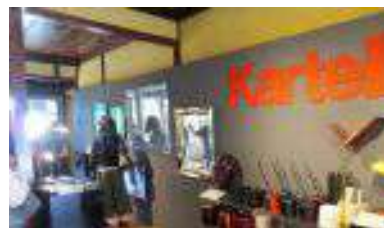
カルテルショールーム