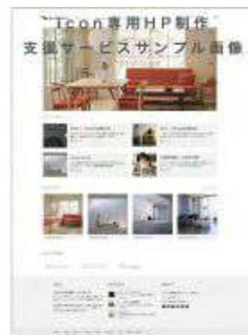
HP制作支援サービス