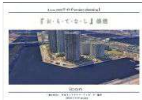
「風と水の広場」おもてなし構想提案書