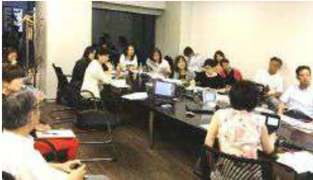
リフォーム入門ゼミ(良質リフォームの会)