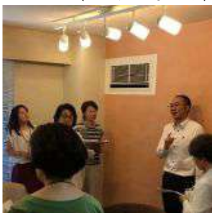
「健康と環境に配慮した壁装材を深く知ろう」シリーズ第1弾

■minicon(iconのminiでミニコン) 会員同士が気軽に集まれる場として企画しています。