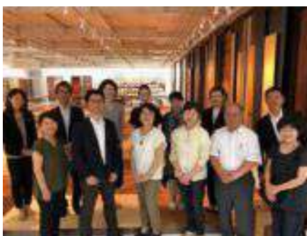
マルホン本社ショールーム見学会