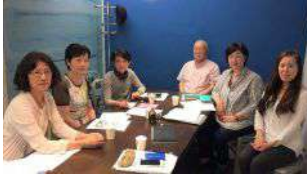
活動風景 ミーティングは18回に上る