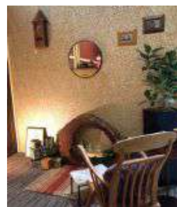
「FOR GOOD 津山展」

岡山にショールームがなく、普段目にするできないメーカーの協力を得て、インテリアコーディネーター向けセミナーと展示会を開催しました。