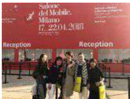
ミラノサローネ研修