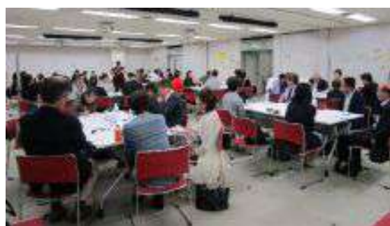
第6回 クロスミーティング