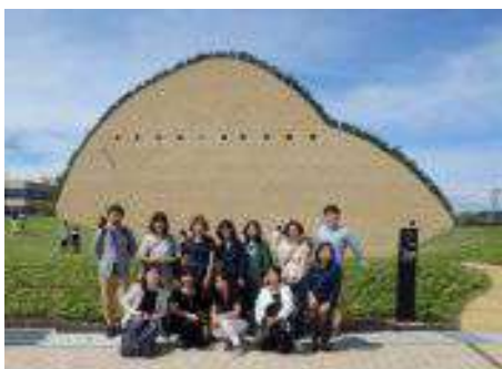
多治見市モザイクタイルミュージアム 設計: 藤森照信