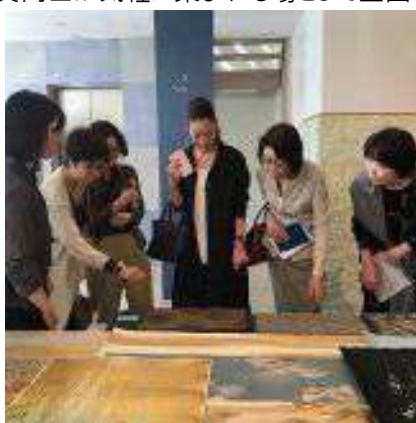
「健康と環境に配慮した壁装材を深く知ろう」シリーズ第2弾

樹脂を使わない天然素材の左官材シリカライム。様々なテクスチャーやカラーのショールームで実務に則したお話をたっぷり伺いました。終了後は有志でランチ会 (7月20日)