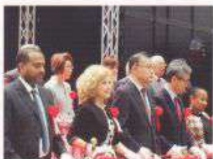
開会式テーブルカット