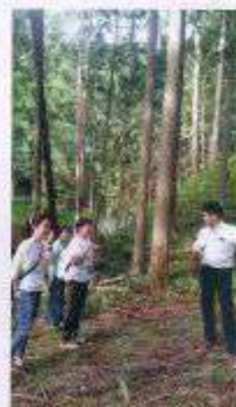
奈良県 吉野杉見学