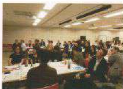
第7回クロスミーティング 会場風景