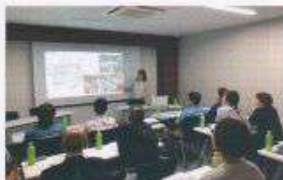
リフォームセミナー風景