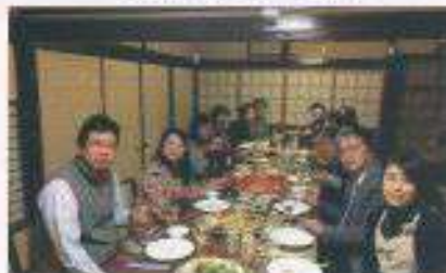
忘年会「内川の家-奈古(古民家再生)」