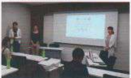
中古リノベーションセミナー風景