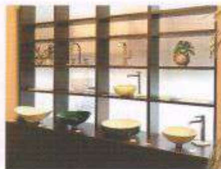
企画展示：最新のボウルと水栓を紹介