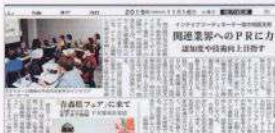
山陽新聞に掲載されました