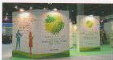
IFFT「JOL防災」出展サポート