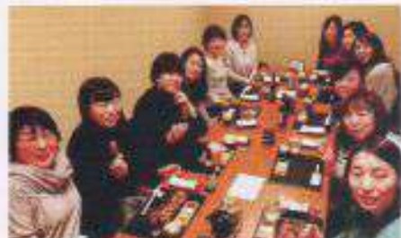
忘年会 会員も増えました