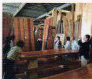
東京中央木材市場 銘木見学