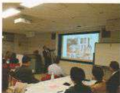
第7回クロスミーティング プレゼンテーション