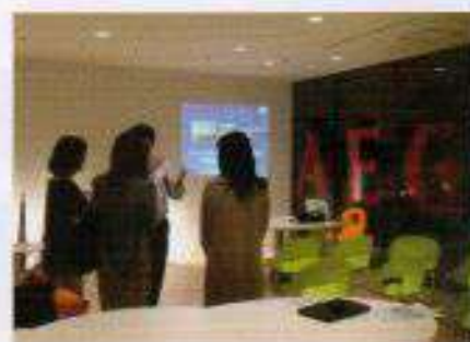
IBMF・AEGと合同企画 オープン調理体験