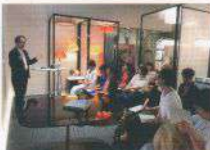
光でつくるホームウェルネスセミナー