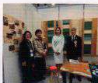
モクコレ出展 本郷林野庁長官・みどりの女神と