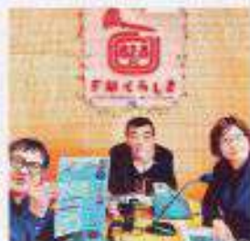
FMラジオで紹介されました