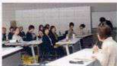
定時社員総会風景