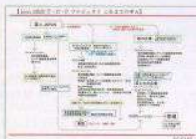
2020 T・O・Pプロジェクト これまでの歩み

自主活動グループとは、icon会員であれば誰でも参加できるグループ活動です。各支部に所属していますが、支部を超え、どの地域からも参加可能です。icon設立当初から存在するグループも、2019年度に活動を始めたグループもあり、誰でもグループを作ることができます。