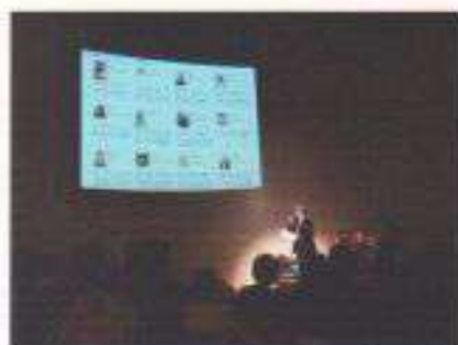
IDMシンポジウム スライド作成