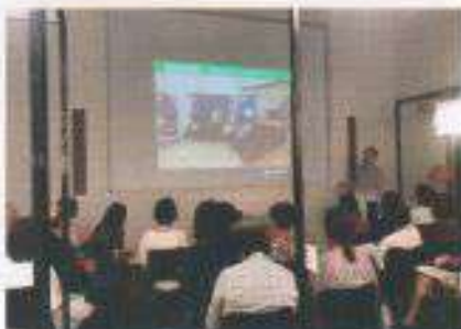
光でつくるホームウェルネスセミナー