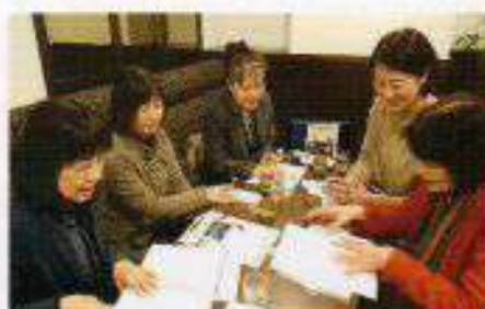
ミーティング風景