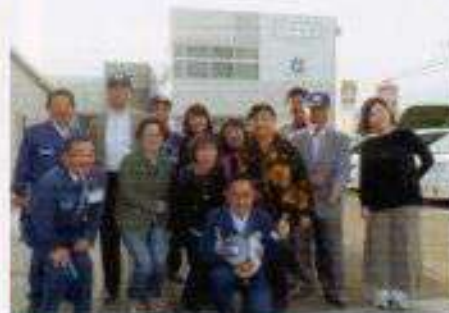
トヨウラ筑西工場 ステンレス加工研修会