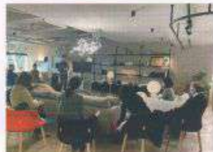
音と光の体験型セミナー