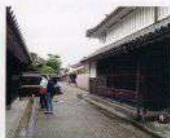
奈良県 今井町見学