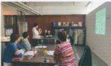
ワークショップ風景