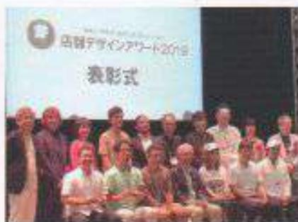
CAFERES JAPAN 2019にて