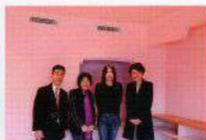
にじいろのおうち