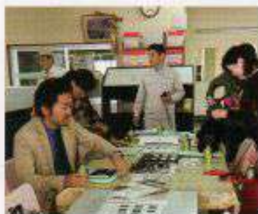
大日化成工業小工場 人工大理石加工研修会