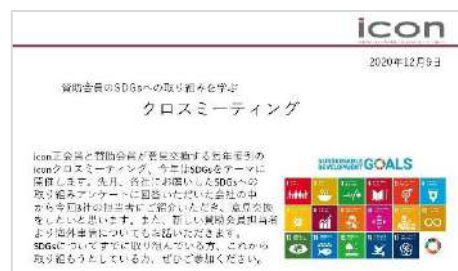
クロスミーティングの案内

卸売制度の年次更新作業を実施、賛助会員全57社のうち34社が登録を更新しました。