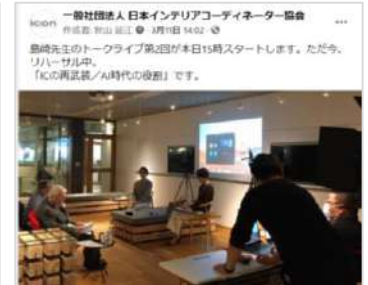
ホームページでの活動紹介、最新情報掲載