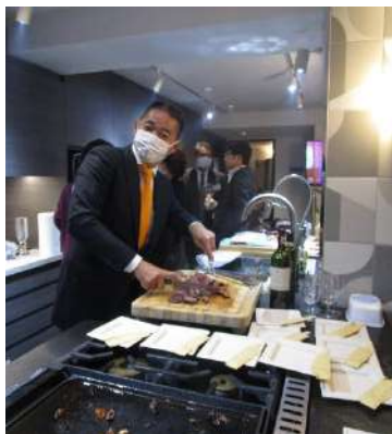
ツナシマ商事新ショールーム 嶋社長自らスーヴィード(真空調理)の実演