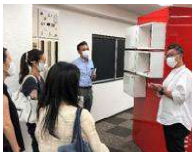
スガツネ工業にて造作金物の勉強会

地元密着型地域新聞「浦安新聞」より取材を受け、「住まいと暮らし」のコーナーにて無限大の可能性があるパウダールームの魅力を伝えました。PR活動のために作成したパウラボカードも、今年度はなかなか活用できませんでしたが、次年度以降は生活者も含めて対外的に存在感をアピールしていきます。