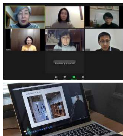
ミニ勉強会「仏壇仏具と防災とインテリア」