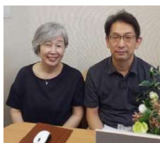
JOL 防災セミナー オンラインを活かし講師も 東京と大阪から、参加者も全国か らと距離を全く感じませんでした