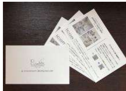
完成したパウラボカード