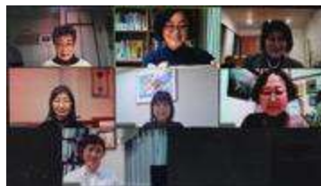
Zoomミーティング風景