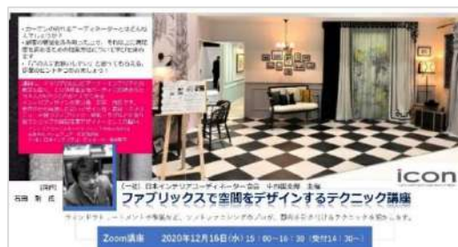
石田氏のセミナー