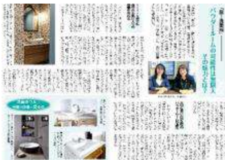
浦安新聞4月24日号「住まいと暮らし」