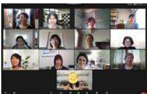
色彩から健康を考えるセミナー