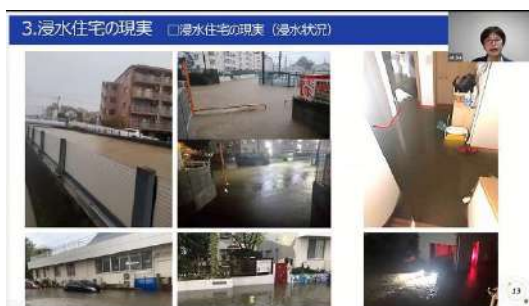
河原さんからお話を聞く会