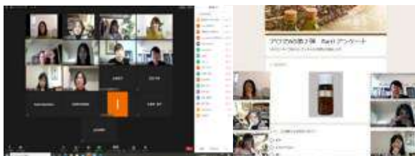
オンラインで楽しもう！アロマテラピーワークショップ第1弾、第2弾