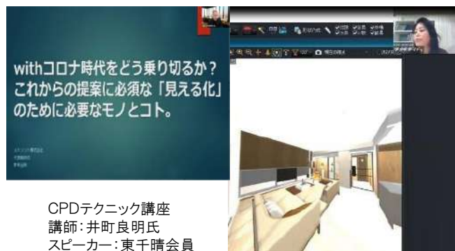
CPDテクニック講座 講師：井町良明氏 スピーカー：東千晴会員