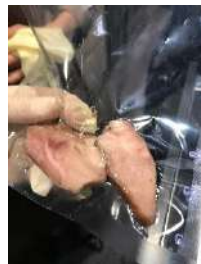
今注目の調理機器バキュームドローワー(左上) と真空パックされた食材(右下)