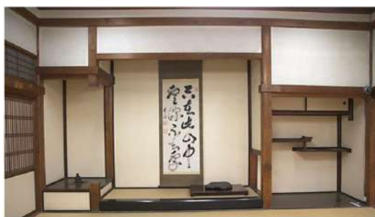
「茶室と床の間」のイメージ(フリー画像より) 茶室の床の間の材や関連話に日本文化の奥深さを学びました