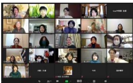
全国の会員とZoom交流会