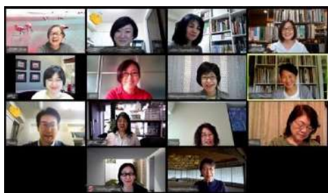
Zoomでセミナーやミーティングを行っています