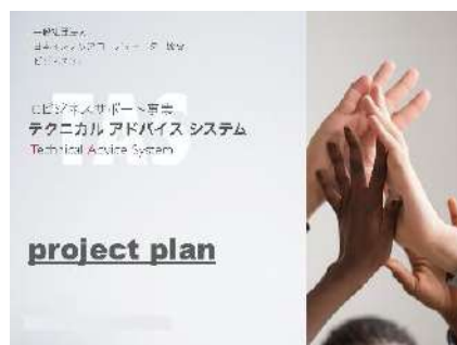
「テクニカルアドバイスシステム」プロジェクトプラン