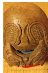
仏具より「木魚」 樹種により音が 違います