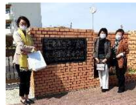
松戸国際高等学校訪問