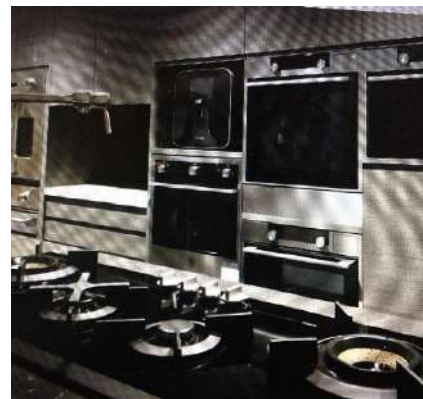
新ショールームに勢ぞろいの輸入設備機器 ガスビルトインオーブンやバキュームドローワー