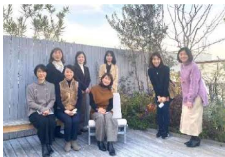
カリモクコモンズ東京見学

12月にはカリモクコモンズ東京で久しぶりにリアルミーティングを行いました。新しい発見もあり、来年度はできるだけ多くのショールームにメンバーで足を運ぶ予定です。