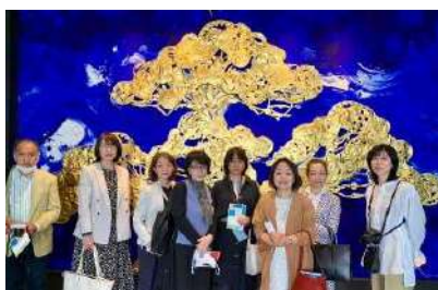
ハイアットセントリック金沢