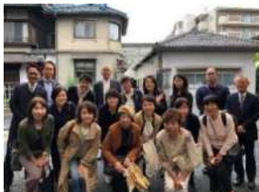
京都織物研修ツアー