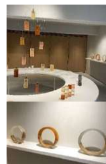
コモンズエントランス

iconの活動は賛助会員の皆様の他、各方面の方々にもご協力いただいています。ありがとうございました (順不同)