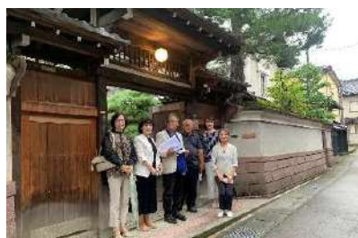
ミナペルホネン金沢