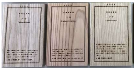
廃棄されない木サンプルを目指して作成された 木言葉文庫本