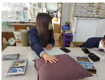
廃棄される玉ねぎの皮の成分を ベースに作られたファブリック