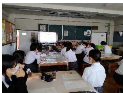
照明セミナーの様子

2023年度も引き続き、同高校でのセミナー開催が決定しました。新たなテーマは「椅子」。賛助会員の協力も得て、高校生が楽しめる、役立つ内容にしていきたいと話し合いを進めています。今後は、セミナーの開催先をさらに広げていくのが目標です。