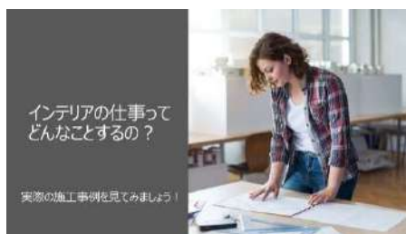
インテリアコーディネーターの仕事って?