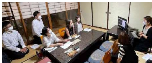
山陰会員のパネルディスカッション