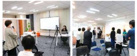
ビギナーズセミナー

会場である賛助会員ノーマンジャパンのショールームの商品説明も大変好評で、メーカーとICをつなぐiconならではのイベントとなりました。