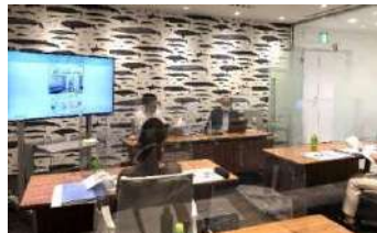
(株)サンゲツセミナー