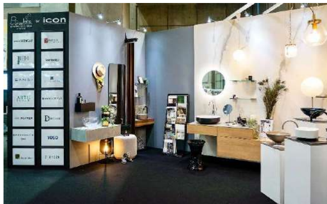
リフォーム産業フェア2022 展示ブース