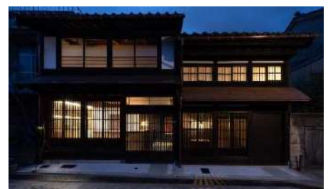
金屋町古民家ホテル「金の三寸」