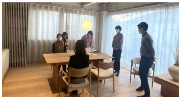
カリモクコモンズ東京見学