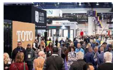
北米見本市トレンドセミナーにて ラスベガスKBIS見本市会場を紹介