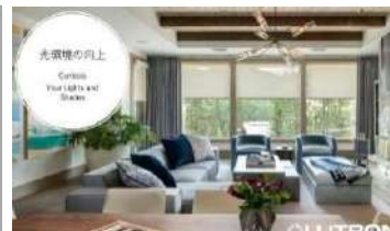
ルートロンアスカ(株)セミナー