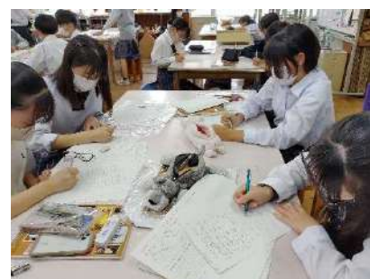
今年度もセミナー後のアンケートに たくさんの記入がありました