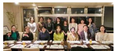
春の交流会&起業塾フォローアップ会

2月に開催されたICフリーランス起業塾のフォローアップとして、会員同士お互いに仕事の悩みやアドバイスを聞く機会となりました。また、久々のリアル交流会となり、次年度への活動のきっかけづくりにもなりました。