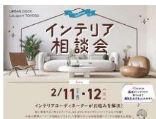
ららぽーと豊洲 インテリア相談会