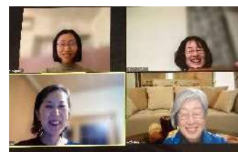
定例ミーティングの様子