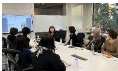
キッチンセミナー

次年度もこれまでの活動をベースに、ショールーム研修・メーカーとのコラボ企画・生活者向けワークショップやセミナーなどに取り組む予定です。