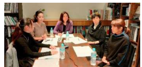
ICフリーランス起業塾

これからフリーランスを目指す会員向けに、起業のために重要な情報を発信するオンライン講座を企画しました。第一線で活躍中のフリーランスIC2名より、先輩として経験談を中心に、営業の仕事のノウハウを伝授しました。