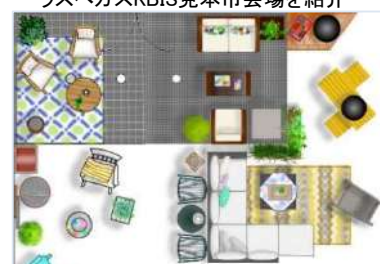
アシュレイホームストア横浜店 ディスプレイ(夏)