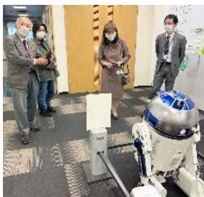
ショールーム見学:スガツネ部品使用ロボット