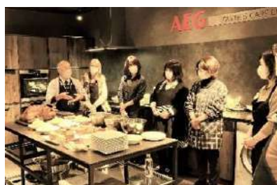
AEGクリスマスイベント 焼きあがったターキーを囲んで