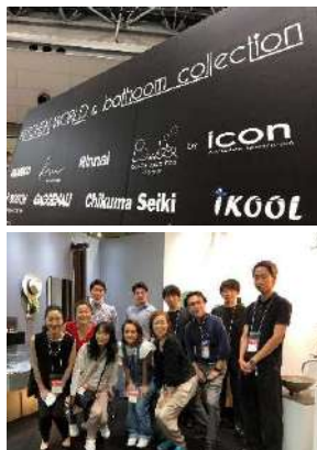
リフォーム産業フェア2022

昨年度から始まったYouTubeパウラボチャンネルは、2023年度バリエーションを増やししながら、引き続きIC目線からのパウダールームの魅力を発信していきます。